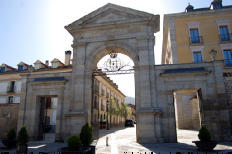
El Palacio Real de La Granja de San Ildefonso, sede de la familia real española, se encuentra en La Granja de San Ildefonso, a unos 40 kilómetros al noroeste de Madrid. Fue construido por el arquitecto Juan de Villaverde y el escultor Juan de San Ildefonso, y es uno de los palacios más importantes de España.

Escrito por Pascual Hernández.