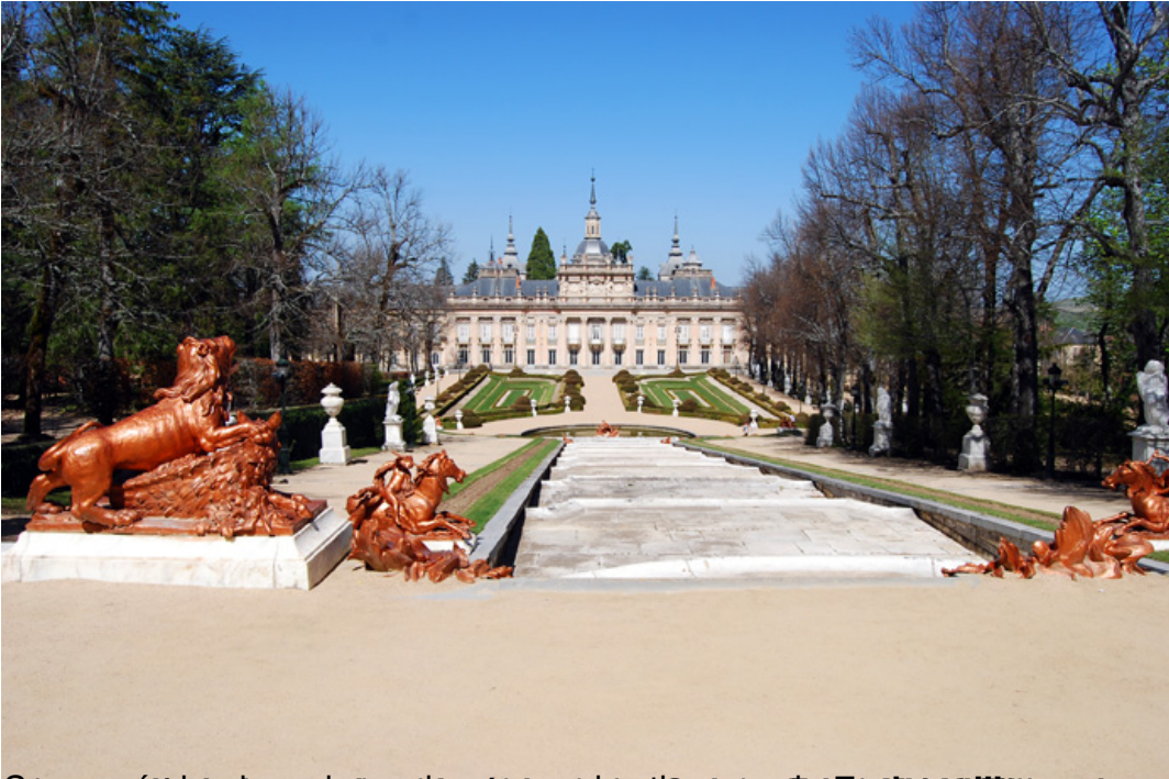
Una granja de San Ildefonso, en la provincia de Segovia, España. Es un lugar muy bonito y con una gran historia. Es un lugar muy bonito y con una gran historia. Pequeña y señorial población

Escrito por Pascual Hernández.